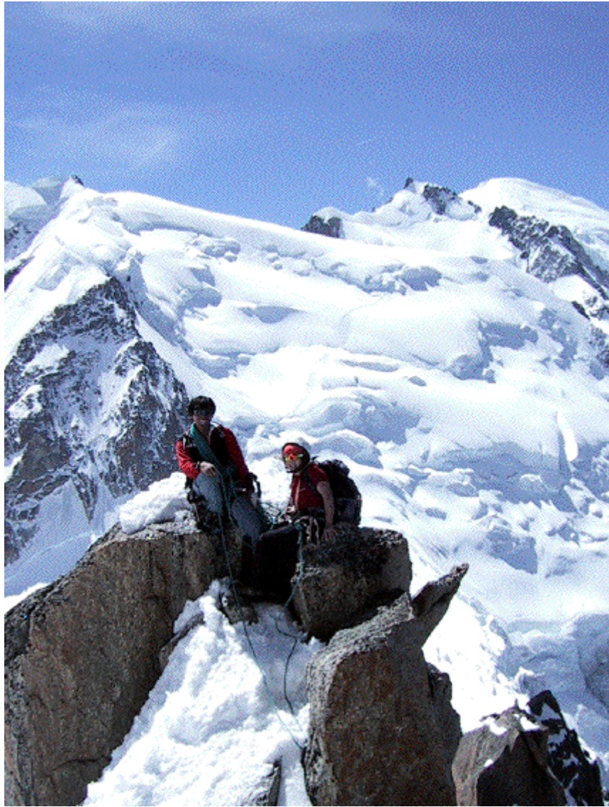
フランス・シャモニ コスミック山稜 終了点 背景はモンブラン山群

海外登山は文句なしに楽しい。旅行と登山両方楽しめるのだから！ぜひとも暇を無理にでも作って、命の洗濯の出かけましょう。