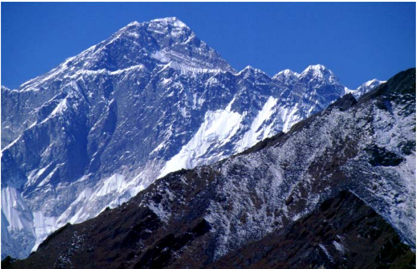
シャンボチェより、サガルマータ（エベレスト）を望む 撮影 ビスタリクラブ 山岸信夫

入会金10000円 年会費10000円 実技講習費1回ごとに実費が必要です。お問い合わせ下さい。