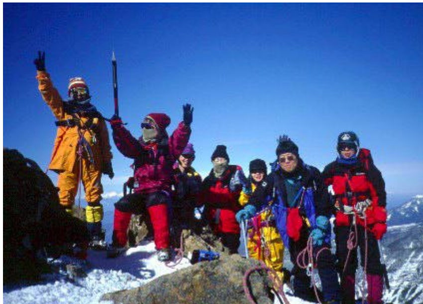
2月・快晴の赤岳山頂にて！

無名山塾は、岩崎元郎が1981年から行っている登山学校です。大阪校では、角谷道弘が、カリキュラムに従って1年間、特に基本に忠実に、安心登山のための技術・知識を身につけます。2年目は、ビスタリクラブにステップアップできます