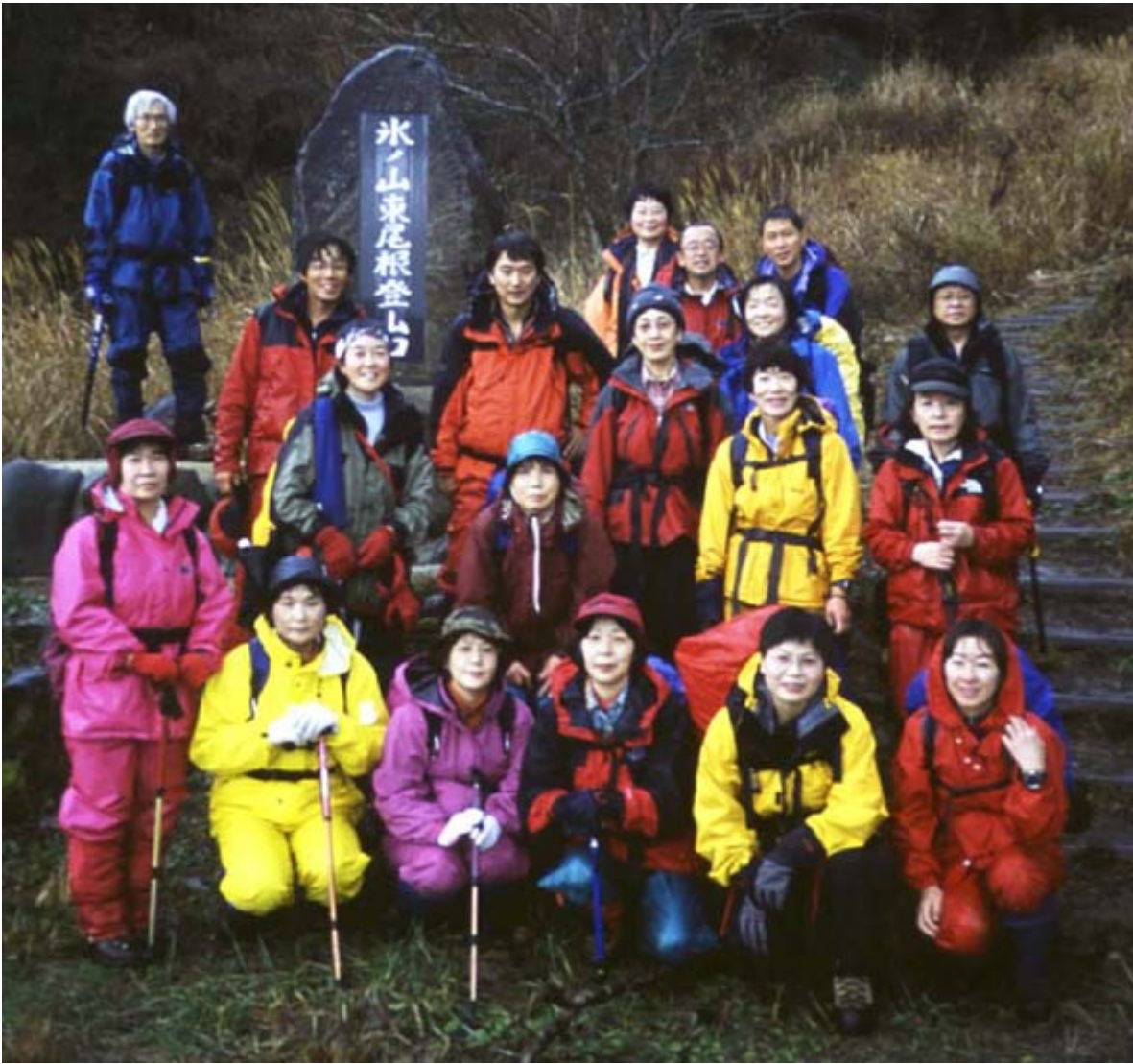
当日は残念ながら、雨、山頂付近は雪がありました。たくさんの参加、ありがとうございました。