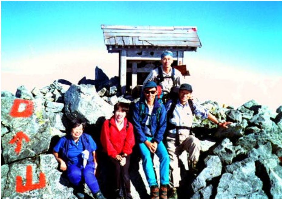
8月の実技教室・剣岳山頂にて