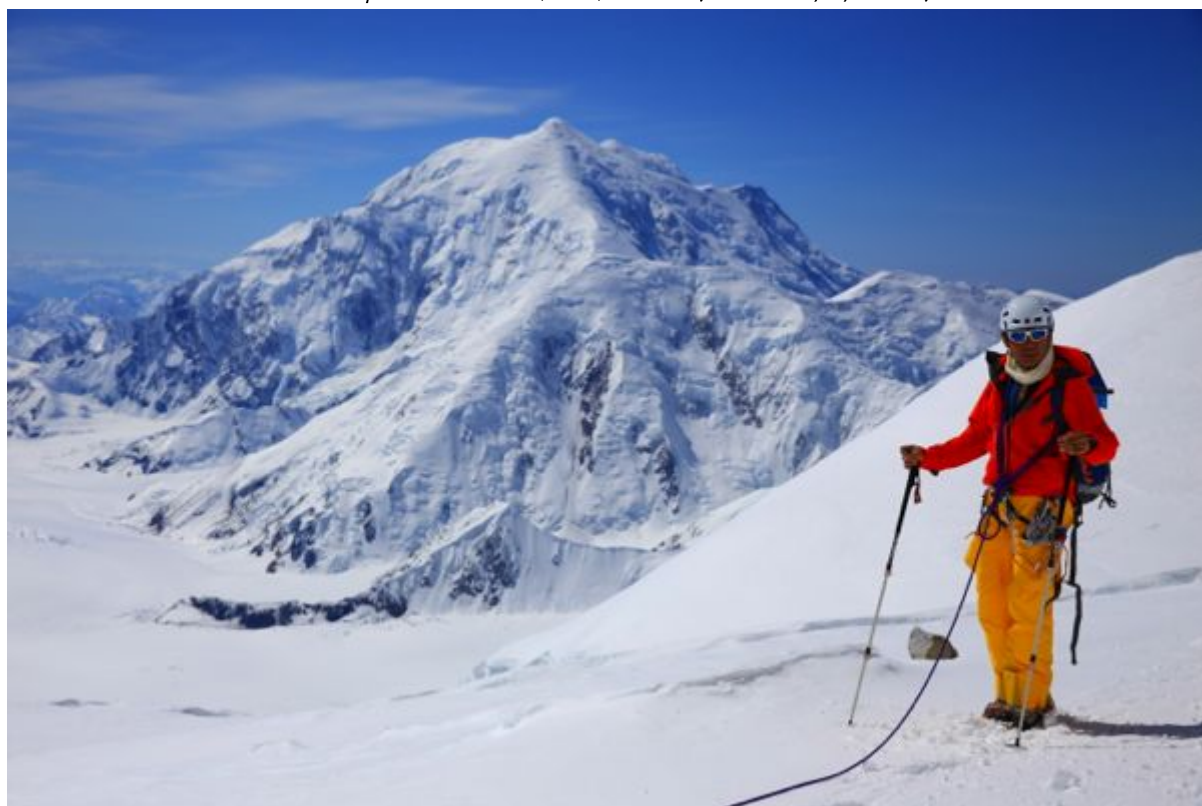
アラスカ デナリ(2015/6)

Last Updated on 30,Nov, 2015. (since Jul/9/1999)