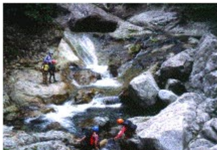
大台ヶ原堂倉谷沢登り！