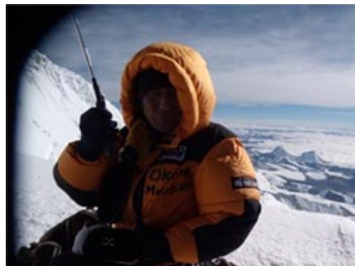
エヴェレスト（8848m）南峰にて